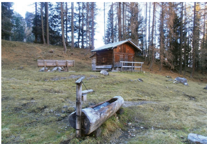
▲ Casòn di Formin, doskonałe miejsce na relaksujący odpoczynek.

na samym początku. Nieco później zaczyna się stopniowo wynurzać turnie grupy Cinque Torri. Przechodzimy po stromym drewnianym moście nad wąwozem Ru dei Loschi i docieramy na eksponowany grzbiet ze zbitego piargu z widokiem na otwierający się poniżej wąwóz Ru de Formin. Teraz szlak biegnie orograficznie po lewej stronie potoku, miejscami w nieco bardziej nachylnym terenie, prowadząc