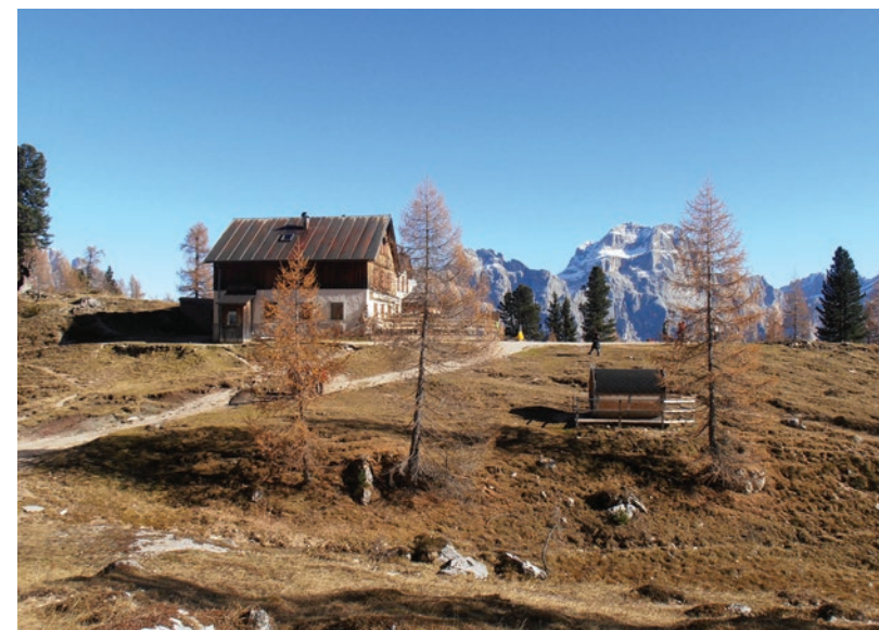
▲ Schronisko Croda da Lago oraz szczyt Sorapis.