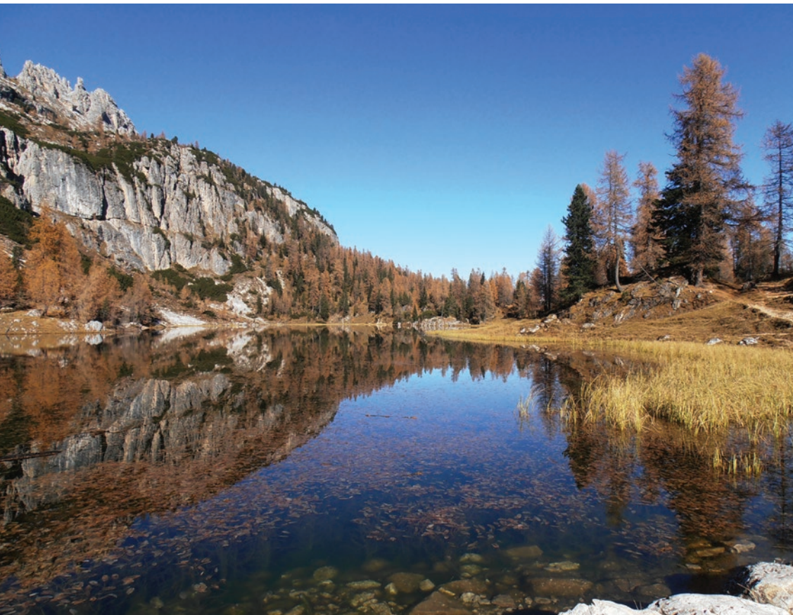
▲ Krystaliczne wody jeziora Lago di Fedèra.

potokowej ( Phoxinus phoxinus ) oraz licznych gatunków roślin, które latem kolorami ożywiają jego brzegi. Jezioro możemy okrążyć dzięki wygodnej ścieżce. Na południowym brzegu znajduje się schronisko Rifugio Croda da Lago imienia Gianniego Palmieriego.