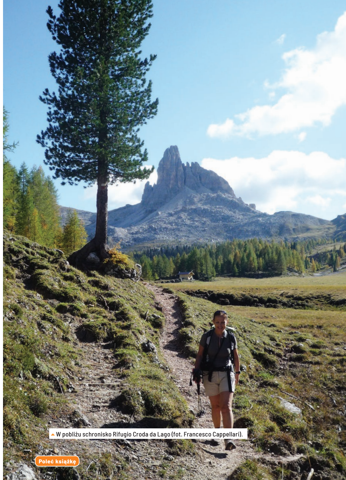
▲ W pobliżu schronisko Rifugio Croda da Lago (fot. Francesco Cappellari).